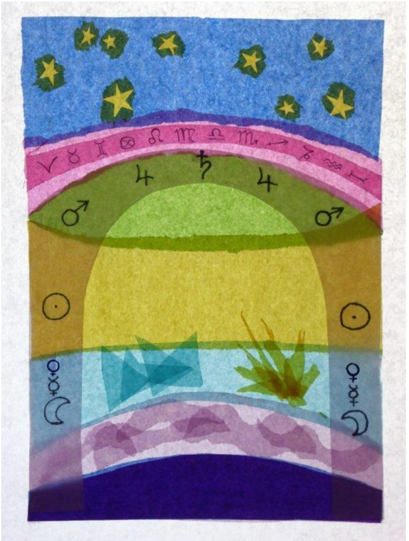
Porte du ciel Côté papier transparent. « Le chemin dans le monde des planètes et des étoiles » Franz Ackermann, 2018