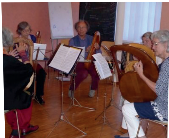
Leierspiel am Regionaltreffen Zürich.